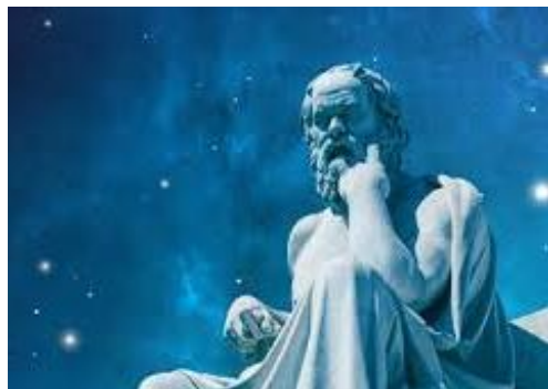
История и философия науки