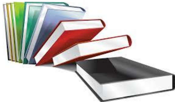
Специальная дисциплина в соответствии с темой диссертации